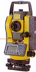
TOPCON GPT 900 A